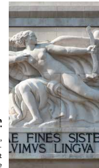
Figura de n'èila cun eles che tira na sèita, bas-relief dl artist Arturo Dazzi, sun l fruent a est dl Monumènt y pert dl'iscrizions per latin