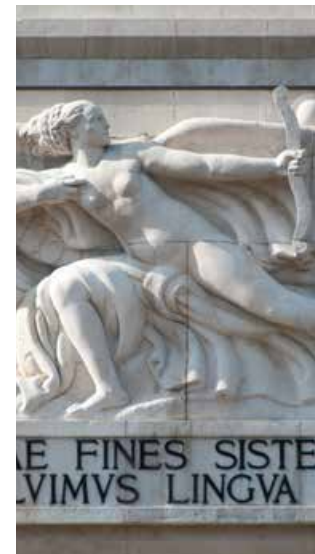
Figura de n'èila cun eles che tira na sèita, bas-relief dl artist Arturo Dazzi, sun l fruent a est dl Monumènt y pert dl'iscrizions per latin