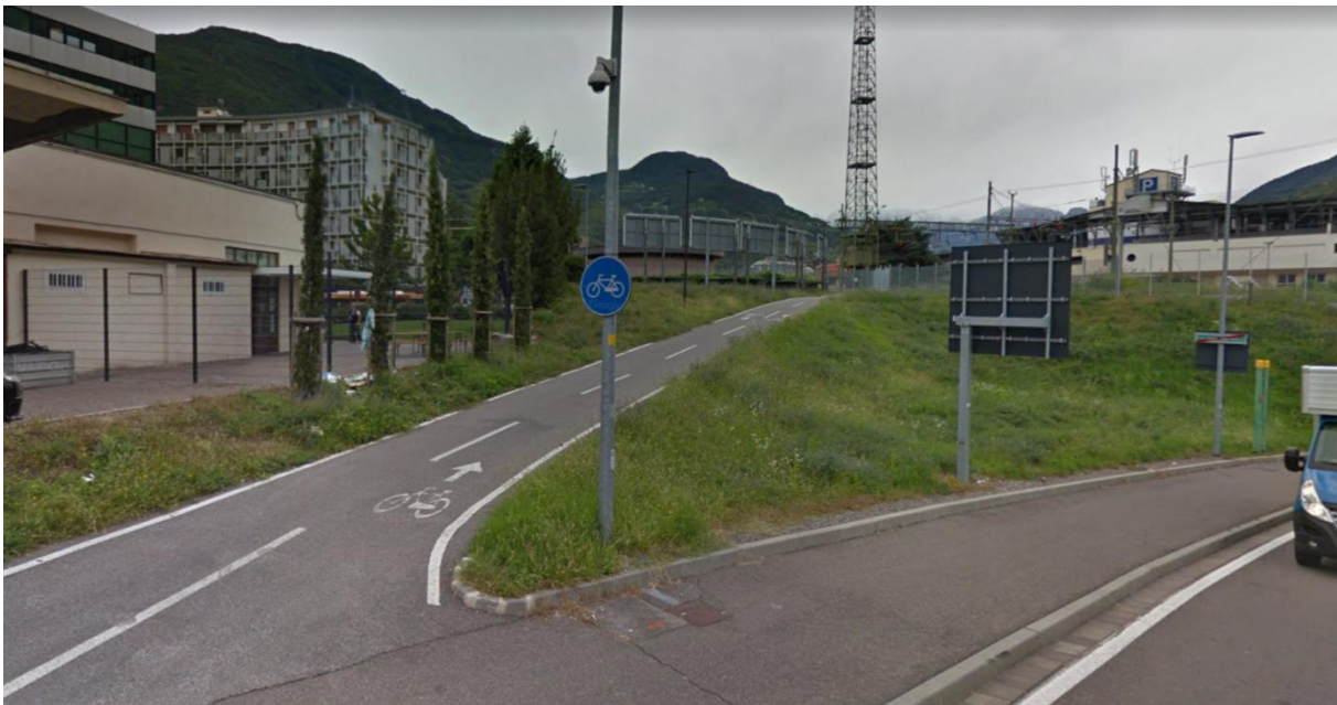
Foto 1: Zona Via Mayr Nusser in direzione area ferroviaria / Mauyr Nusser Straße in Richtung Bahntrasse