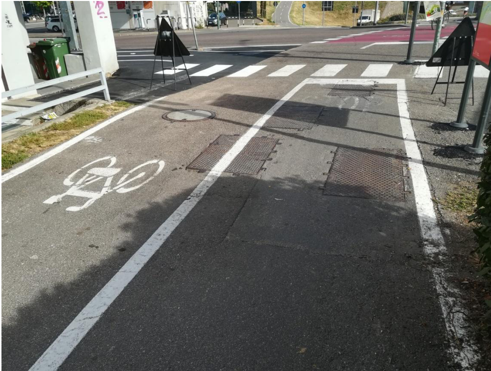
Foto 7: Incrocio ciclabile - via Mayr Nusser –ponte Loreto / Kreuzung Radweg - Mayr Nusser Straße – Loretostraße in Richtung Bahntrasse