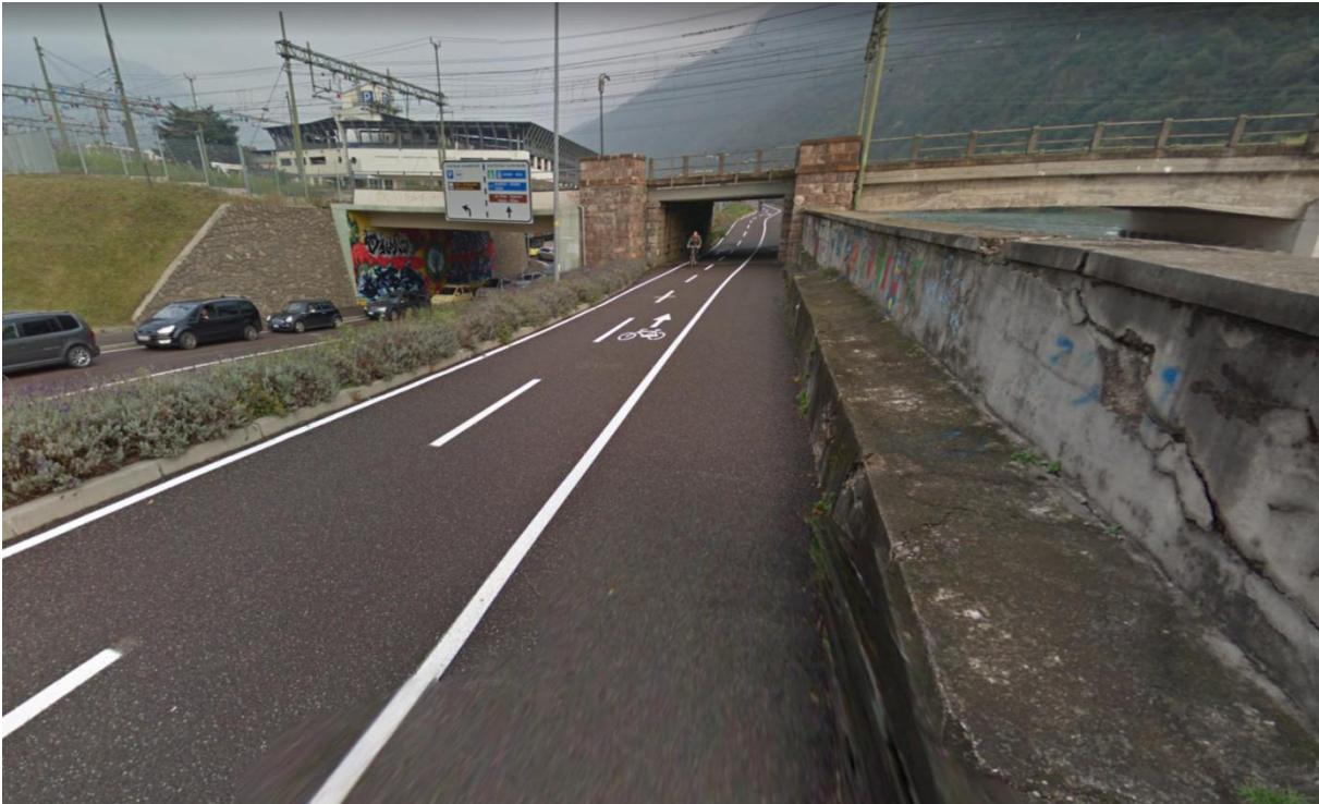
Foto 3: vista da ciclabile in direzione ferrovia / Radweg in Richtung Bahntrasse