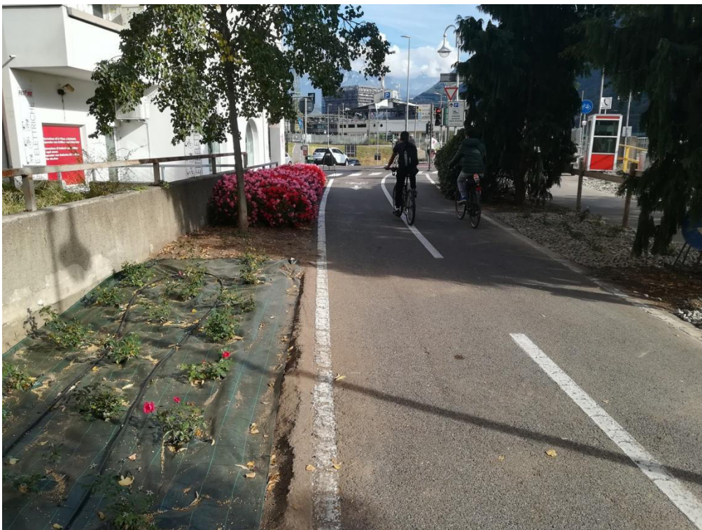
Foto 8: ciclabile in direzione via Mayr Nusser / Radweg in Richtung Mayr Nusser Straße

GR/L:\Bozen\KHB1++039-17 Kaufhaus Bozen Infrastrukturen\B_Planung & Entwicklung\180903_Auszugsprojekt SW_Gas_TW\A_Texte\181210_PA_Auszug_Teil_Verdip_MNStr\KHB1_181210_A.02_Fotodokumentation.docx