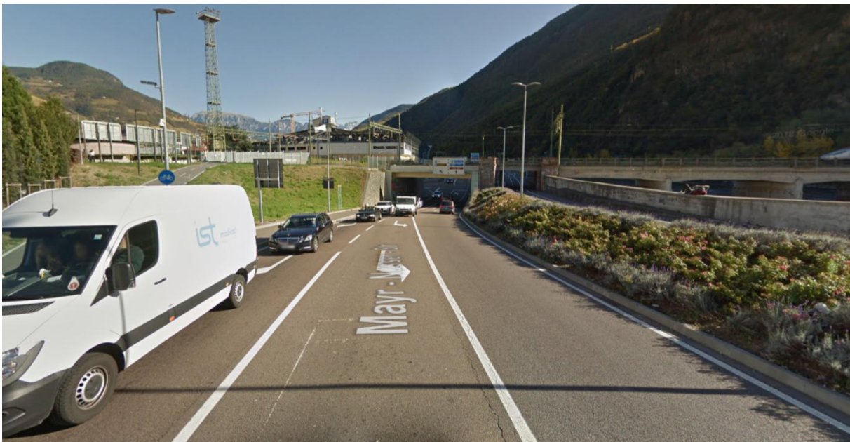
Foto 2: vista da strada in direzione ferrovia / Ansicht Straße in Richtung Bahntrasse