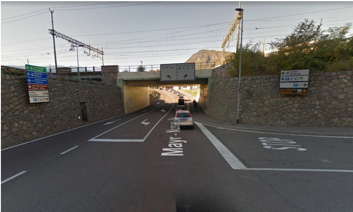
Foto 5: Incrocio via Mayr Nusser –via Macello in direzione ferrovia / Kreuzung Mayr Nusser Straße – Schlachthofstraße in Richtung Bahntrasse