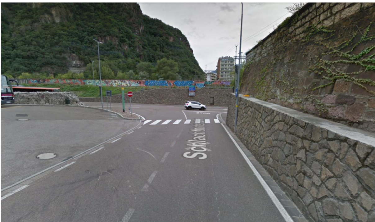
Foto 6: Vista via Macello in direzione via Mayr Nusser / Schlachthofstraße in Richtung Mayr Nusser Straße