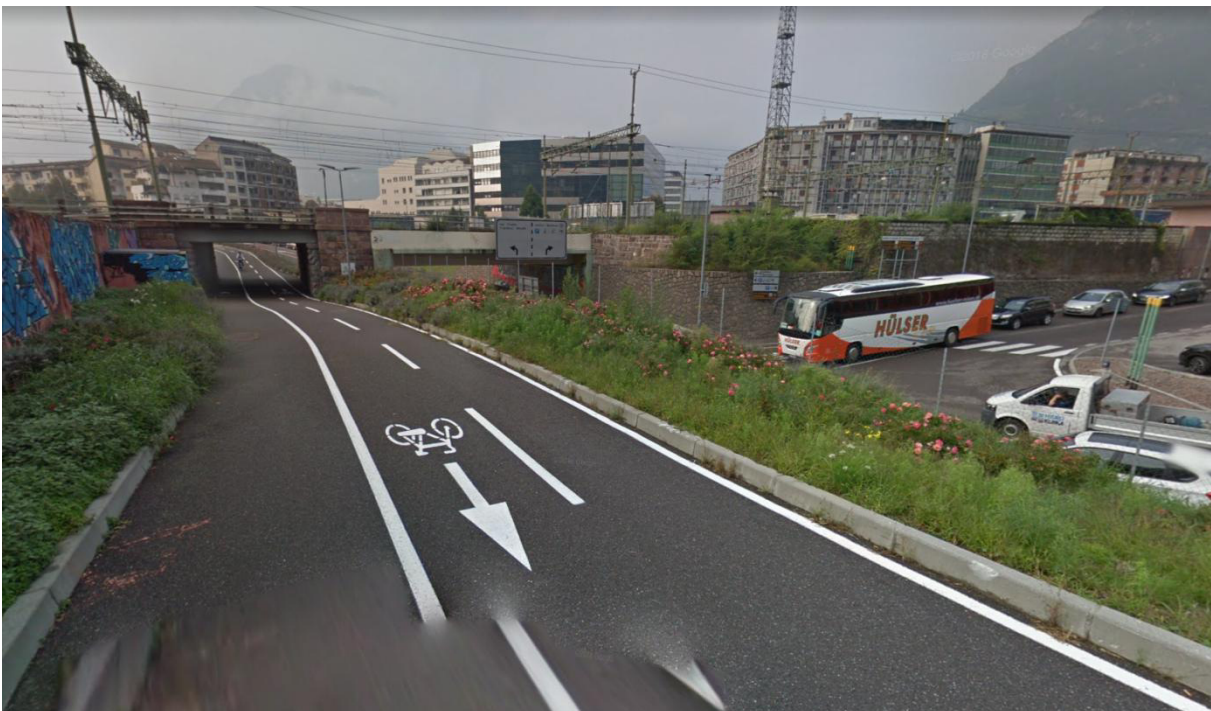
Foto 4: vista da ciclabile in direzione ferrovia / Radweg in Richtung Bahntrasse