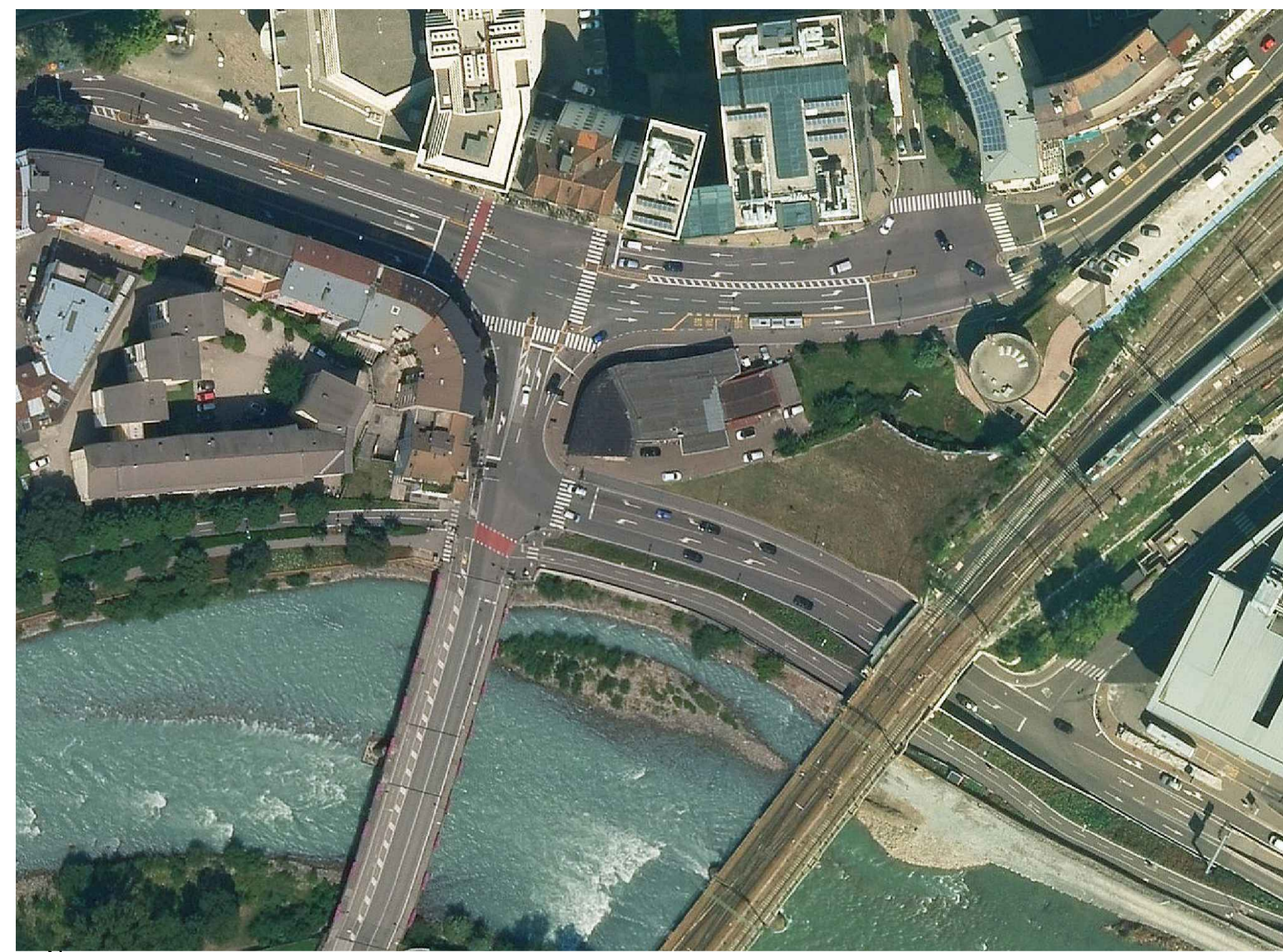
ORTHO FOTO ORTOFOTO M 1 : 1.000